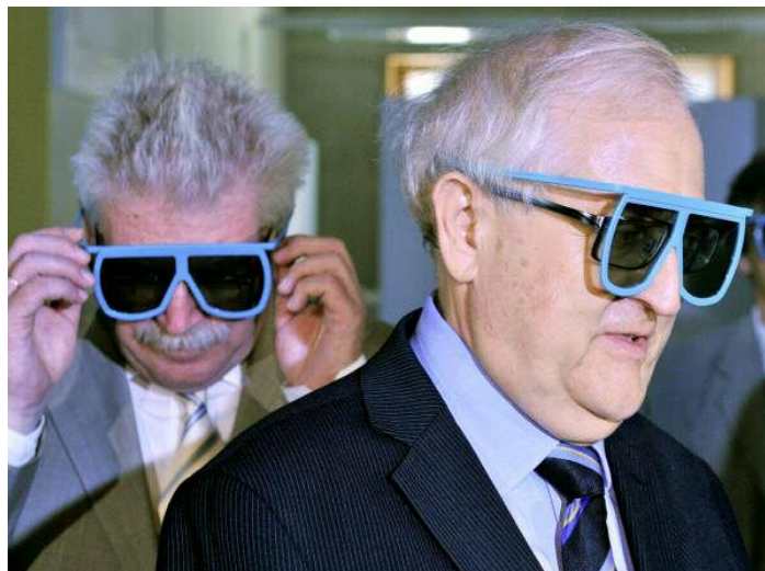
Wirtschaftsminister Brüderle (r.): Falsches Rezept, richtiges Thema

Es war Bundeswirtschaftsminister Rainer Brüderle, der in der vorvergangenen Woche das Thema zurück auf die politische Tagesordnung brachte. Der Vor-