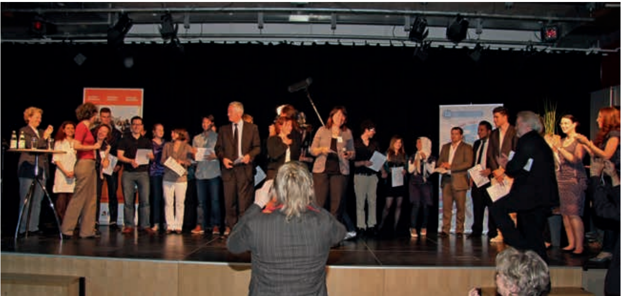
Die Local Players nach der Übergabe der Teilnahmeurkunden