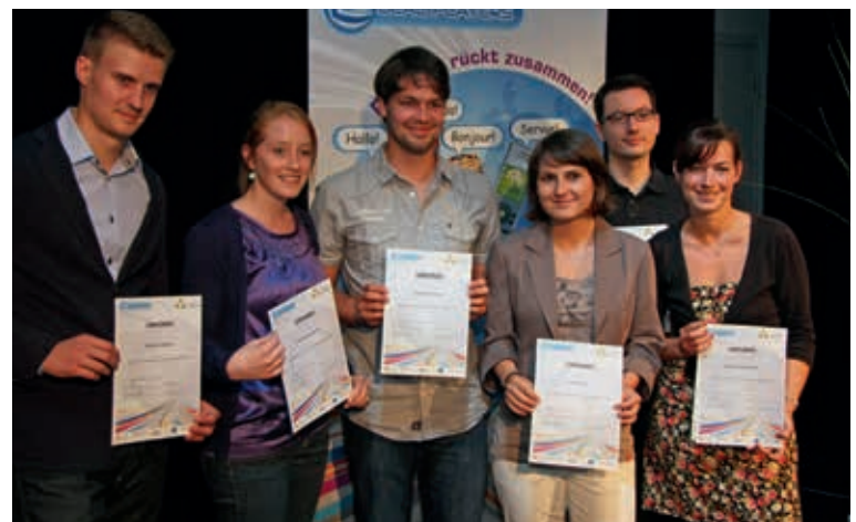
Ein Teil der erfolgreichen Absolvent/innen zeigen stolz ihre Urkunden

Unter www.local-players.de finden sich weitere Informationen über das Projekt.