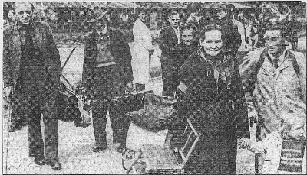
Eine der größten Migrationsbewegungen überhaupt – Flüchtlinge und Vertriebene nach dem Zweiten Weltkrieg. Hier im münsterschen Lager Mecklenbeck als erster Unterkunft.

In der Öffentlichkeit ist beispielsweise kaum bekannt, dass schon das Kaiserliche Deutschland ein Zuwanderungsland war: 1913 wurden 1,2 Millionen Ausländer gezählt, hinzu kamen 500 000 so genannte Ruhrpolen (die aber die preußische Staatsangehörigkeit besaßen). Mit