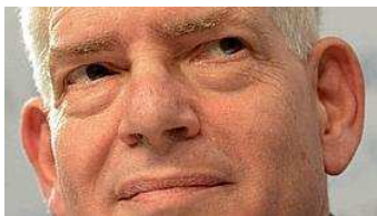
Josef Schuster, Zentralrat der Juden

Polizeischutz ist leider die Normalität </interview/polizeischutz-ist-leider-die-normalitaet a 21,0,167682131.html>